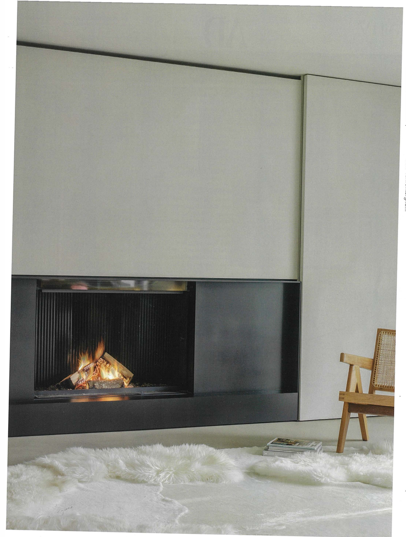
Architectural fireplaces Made in Belgium metalfire.eu 1@